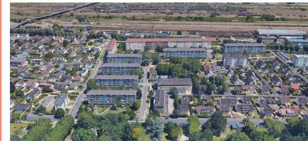
Sotteville-lès-Rouen (76) Gadeau de Kerville